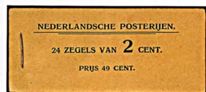
boekje 4 1921 met beige kaft