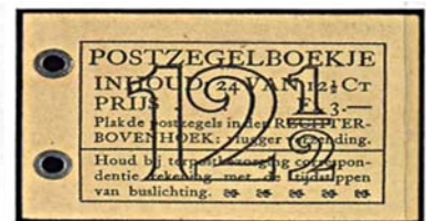
boekje 49 1940