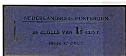
boekje 2 1908 met blauwe kaft