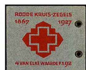
boekjes 39Links en 39Rechts 1927

In de speciale catalogus van de N.V.P.H vindt u een uitgebreide katern van dit onderwerp.