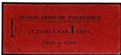
boekje 1 1902 met rode kaft