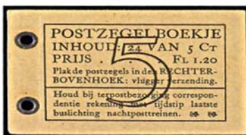
boekje 25e 1927