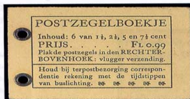
boekje 36 1940