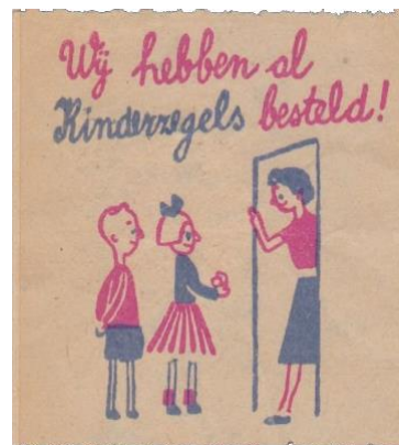
Deurbelzegel van 1954

Tegenwoordig worden de kinderen perfect ondersteund in de verkoop met behulp van een app die hen de administratie vergemakkelijkt en het moeilijke rekenwerk uit handen neemt. Sindsdien zijn de kinderen nog enthousiaster bezig in de verkoop binnen de buurt en in de familie- en kennissenkring. Daarmee wordt ook het motto Door het Kind - Voor het Kind concreet gemaakt. Al deze acties leveren dan weer een hele rij van verzamelobjecten op: deurzegels, prentbriefkaarten voor het kind, kinderbedankkaarten, dankzeggingen aan/voor kinderen. Zeer herkenbaar, want het grootste deel van onze bevolking heeft in zijn of haar jeugd aan die deur-aan-deur actie meegedaan.