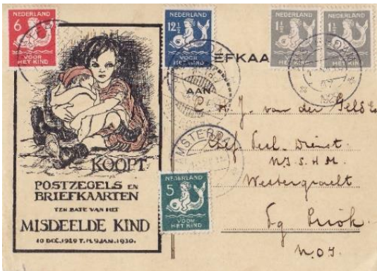
Briefkaart met reclame

Dat heeft allereerst betrekking op de kinderzegels die vanaf 1924 zijn uitgegeven, waarvan de toeslag naar de kinderbescherming ging. Maar er is nog veel meer dat bij deze acties verscheen: ontwerpen, folders, affiches, plaatfouten, machinestempels voor het kind, e.d.